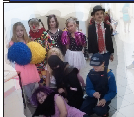
Str. nr 5 ZABAWA KARNAWAŁOWA