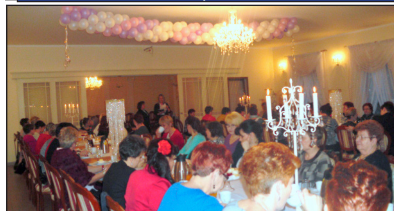
Str. nr 5 SPOTKANIE PAŃ Z GMINNEJ RADY KOBIETY