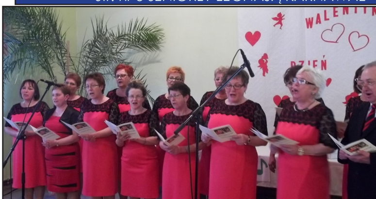
Str. nr 11 WALENTYNKOWY FESTIWAL W LISZKOWIE