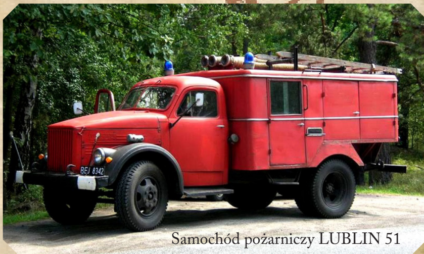
Samochód pożarniczy LUBLIN 51

Jedyną mankamentem tego samochodu był brak własnego zbiornika wodnego przez co strażacy musieli budować długie linie gaśnicze, by podać wodę z najbliższego stawu lub jeziora.