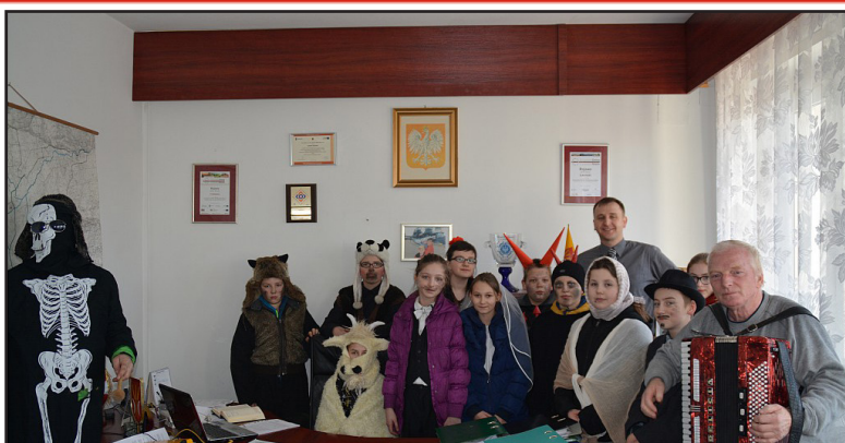
Str. nr 8 HARCE KOZY ROJEWSKIEJ