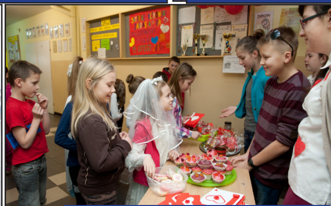
Str. nr 5 WALENTYNKI W SP ROJEWO