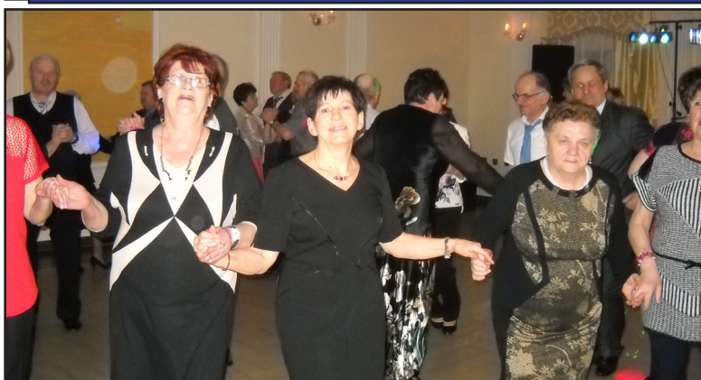
Str. nr 6 SENIORZY ŻEGNAJĄ KARNAWAŁ