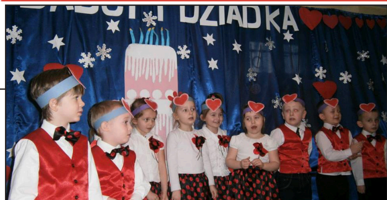
Str. nr 4 ŚWIĘTO BABCI I DZIADKA