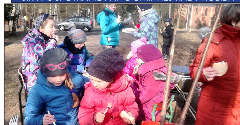
Str. nr 6 FERIE ZIMOWE BEZ NUDY