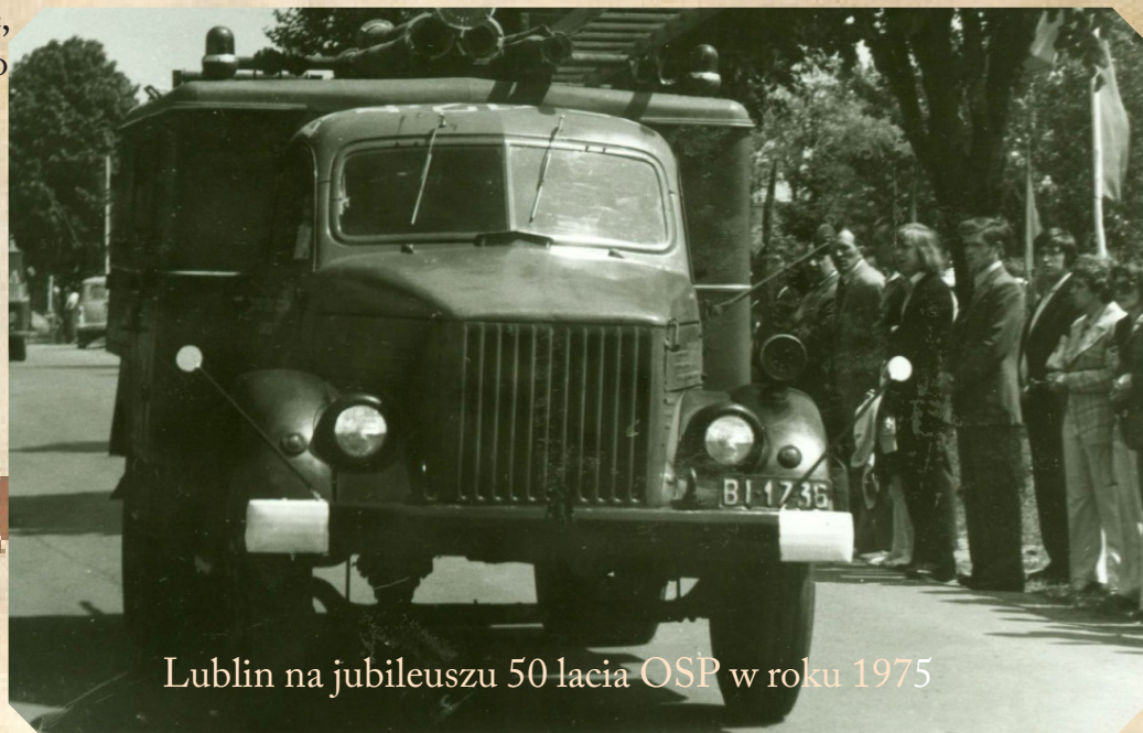
Lublin na jubileuszu 50 lacia OSP w roku 1975