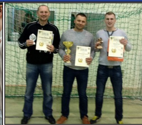
Str. nr 10 V Finał RLHPN